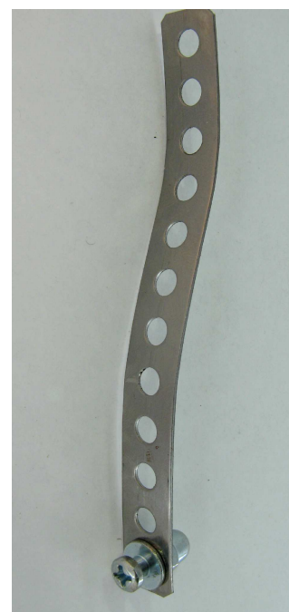
ÉCARTEUR POUR LOCK