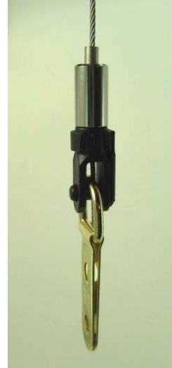
CLEVIS + attache D (côté)