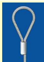
Câble avec boucle sertie pour gonds et crochets muraux

Ces accessoires sont des câbles munis d'une terminaison adaptée à l'usage requis (Longueur 30cm environ, Ø1 à 1,8mm)