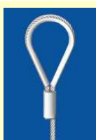
Câble à boucle + cosse pour gonds et crochets (charges lourdes)