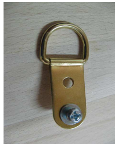
Anneaux dé pour fixation sur crochet (mural ou de tringle)