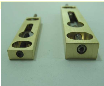
Position des vis de verrouillage activées

Données obtenues avec fixation sur le cadre par vis Ø3x20 (LOCK6) et 4x25 (LOCK8)