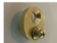
Pendulo: compensateur d'erreur d'entraxes

Sur demande: patte spéciales pour cadre de transport MTR