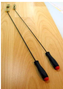
Micro tournevis extra-longs pour verrouillage latéral