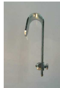
Crochets pour grilles de réserves