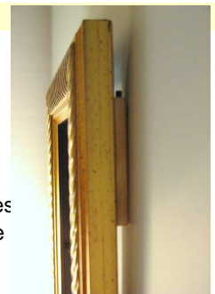
Vis antivol invisible

Les LOCK sont fixés de part et d'autre du tableau. Leur originalité est de ne présenter aucun mécanisme de condamnation visible. Une fois vissée, la vis de verrouillage disparaît dans le corps du LOCK . Le démontage exige de connaître l'empreinte de la vis utilisée et la possession d'un tournevis à très longue lame difficile à acquérir. La fonction de réglage obtenue par la vis supérieure permet les corrections de hauteur et de niveau. Le tournevis est le même que celui utilisé pour les vis de verrouillage. (Sur demande autres empreintes possibles)